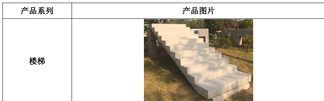
图表 2 公司产品种类及用途