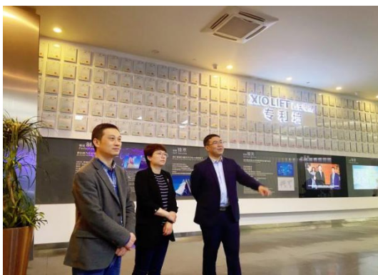
企业高层考察观摩