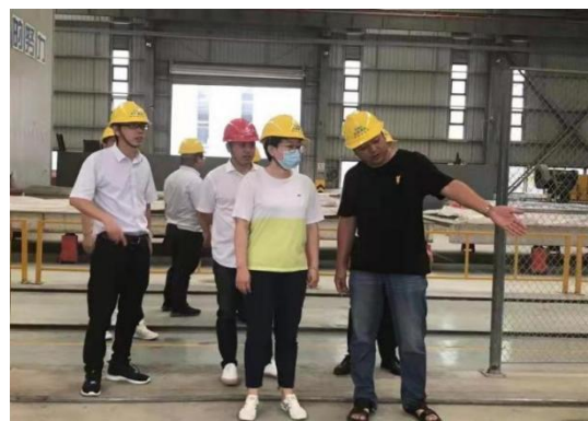
企业高层赴合作公司考察