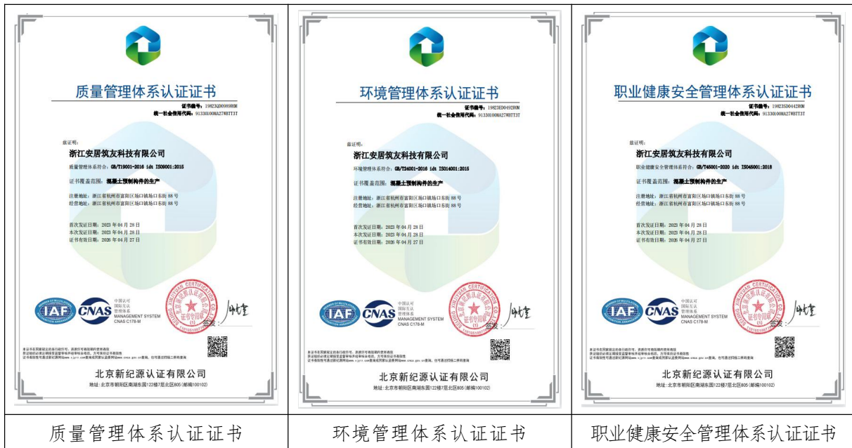
图表 3 体系认证证书

安居筑友于 2022 年导入“浙江制造”模式进行管理，结合质量、环境、职业健康安全、卓越绩效管理、质量诚信标准要求建立了综合型管理体系。