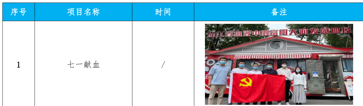
图表 15 安居筑友部分公益活动一览表

公司一直将社会公益活动视为企业活动的一个重要组成部分，致力于解决社会发展中的急迫问题。高层领导和相关部门对公益支持进行系统策划，根据企业不同发展阶段和战略重点确定投入公益支持的原则和优先次序，做到既真正有利于社会，又利于企业发展。结合企业的使命、愿景和价值观以及企业发展战略确定了公益支持的原则为“我们支持社会，文化，教育等事业的发展以及紧迫问题的解决”，确定了重点支持的公益领域为“送温暖、献爱心”慈善活动及灾区捐赠。历年来公益支持金额达到百余万元。